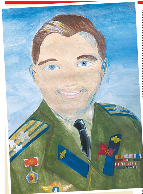
Рисунок Анны Тимофеевой, 6-й класс гимназии

Яна ТЕРЕХОВА, учащаяся 7 «В» класса гимназии