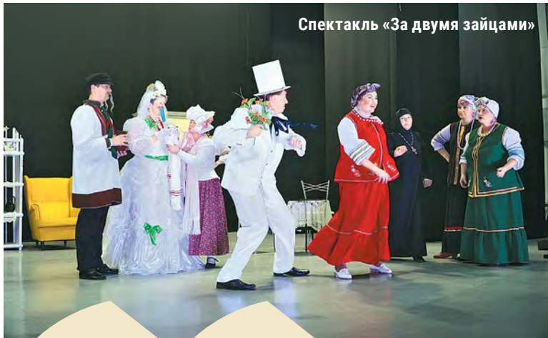
Спектакль «За двумя зайцами»

— Подготовка к спектаклю у нас очень серьёзная: обязательная разминка, уроки актёрского мастерства, сценического движения, речи. Каждое слово должно быть сказано чётко, движение выверено — только тогда актёрское действие имеет смысл, — рассказывает художественный руководитель.