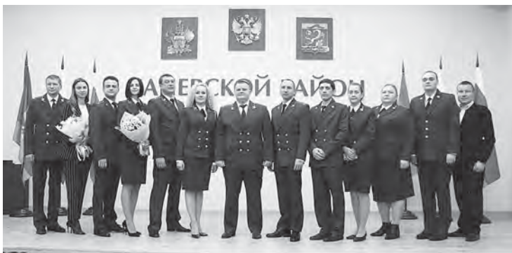
Пресс-служба администрации Каневского района

Каневчане заняли второе место в конкурсе «Лучший коллектив прокуратуры Краснодарского края». Победителей и призёров определили на заседании коллегии в прокуратуре края. На нём подвели итоги и утвердили результаты конкурсов на звание «Лучший коллектив прокуратуры Краснодарского края», «Лучший прокурор, осуществляющий надзор за соблюдением федерального законодательства, прокуратуры Краснодарского края», «Лучший прокурор, осуществляющий надзор за уголовно-процессуальной деятельностью, прокуратуры Краснодарского края», «Лучший государственный обвинитель прокуратуры Краснодарского края» за 2023 год.