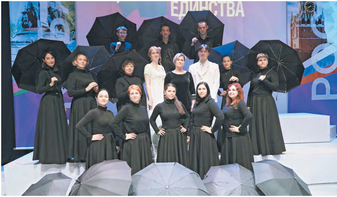
Пластический эпиграф к пьесе Николая Островского «Гроза»