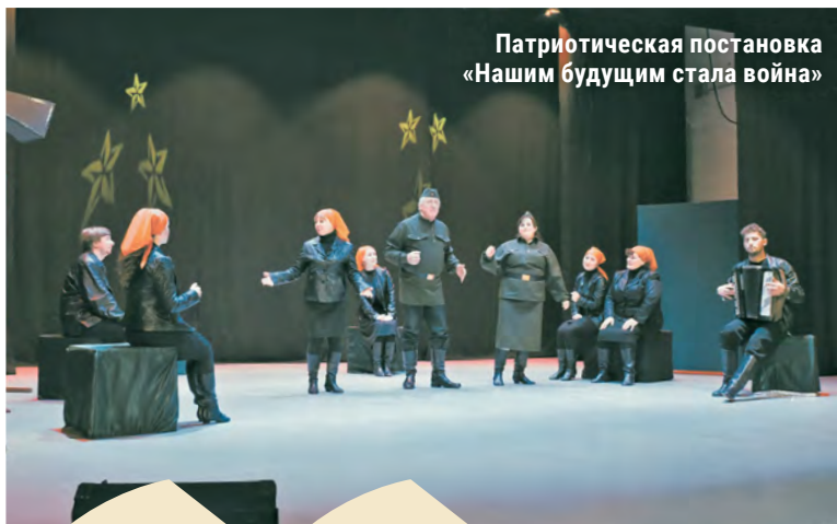
Патриотическая постановка «Нашим будущим стала война»