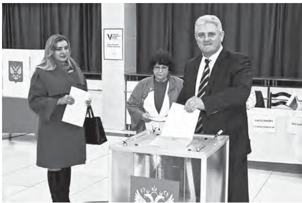
По материалам пресс-службы администрации Каневского района

Нарушений на избирательных участках не выявлено.