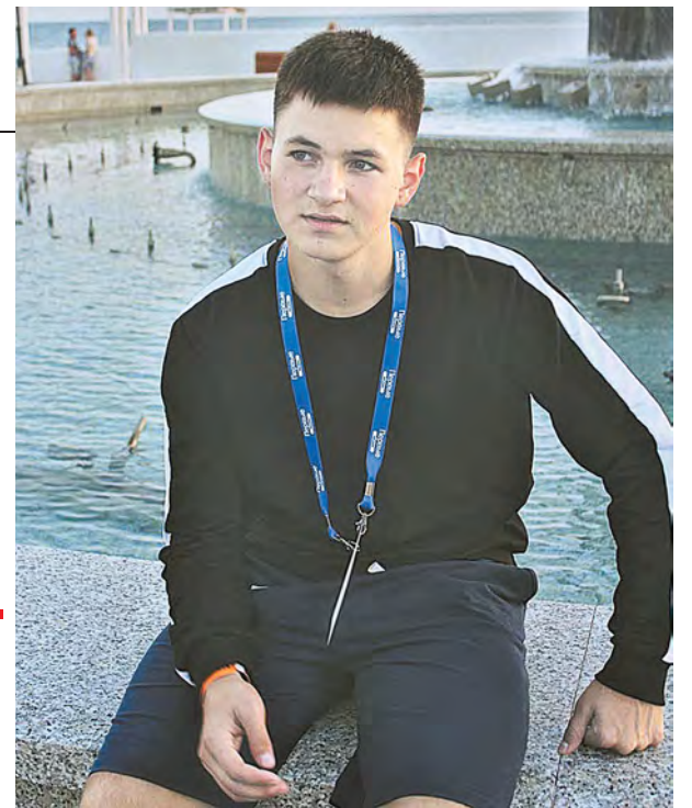
На Всероссийском молодёжном форуме «Медиапритяжение» в Сочи