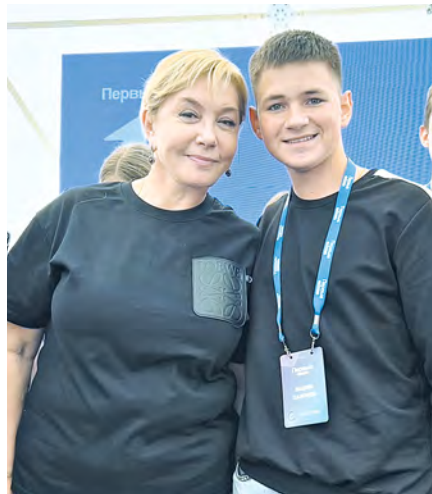
С российской телеведущей Ариной Шараповой